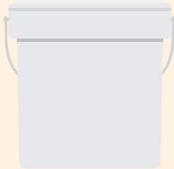
Balde de 5 kilos